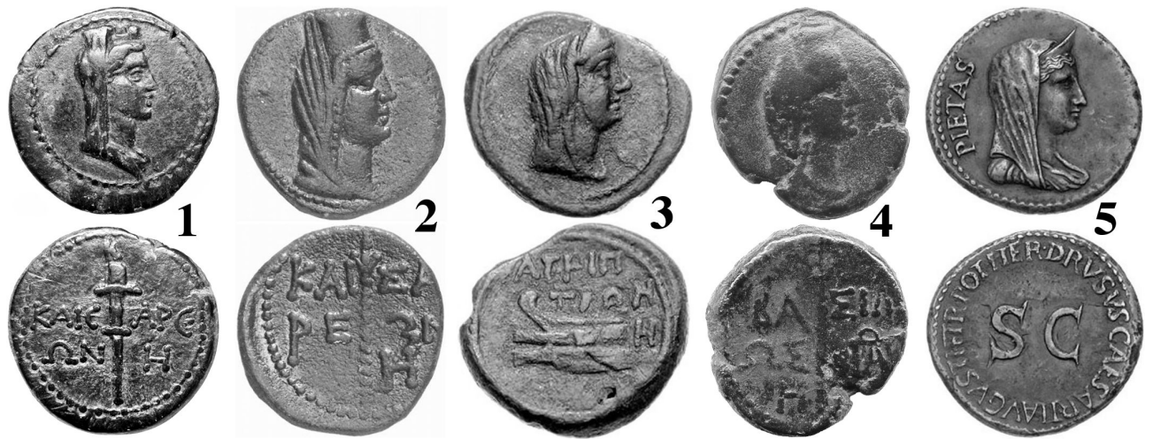
Рис. I. 1 – обол Кесарии (37/38 г.); 2,3 – оболы (1 г. до н.э. – 10 г. н.э.) Кесарии и Агриппии; 4 – обол (10/11 г.) Аспурга; 5 – дупондий (22/23 г.) с портретом Ливии.

сионная лакуна царских статеров с 296 по 299 гг. б.э. (2/1 г. до н.э. – 2/3 г. н.э.) указывают на монополию монет Кесарии и Агриппии в течение нескольких (до 3-х) начальных лет их чеканки с ок. 1 г. до н.э.. Тогда некие серьёзные политические и/или военные потрясения настолько ослабили власть боспорского царского дома, что вынудили его пойти на расширение полисного самоуправления в виде предоставления городам неких вольностей, льгот и прав, индикатором которых и стала полисная чеканка. Демонстративно выражаемая ею лояльность проявилась не к царям Боспора, а напрямую к патронату Рима, что отразилось как в новых городских названиях, так и в портрете Ливии на монетах Кесарии 4 [Friedlaender, 1870, S. 283-284;